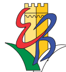
Istituto di Istruzione Superiore "Ettore Bolisani"