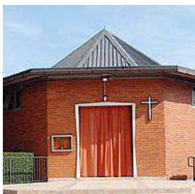
La chiesa di Malborghetto