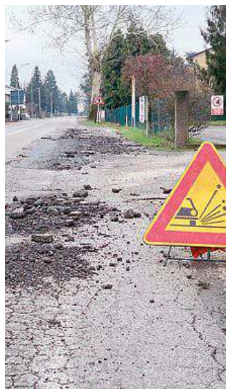
Una strada dissestata